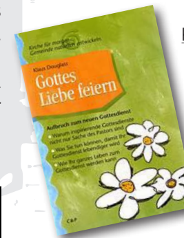
Klaus Douglass, Gottes Liebe feiern. Aufbruch zum neuen Gottesdienst.